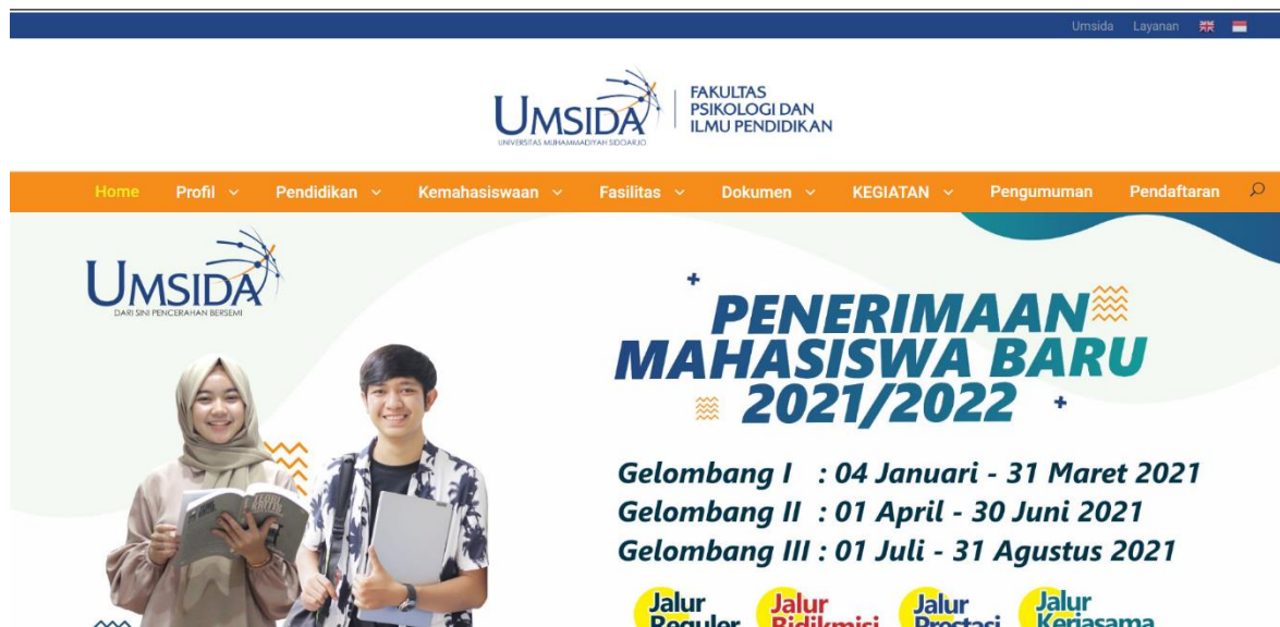
Gambar 2. Website FPIP

Penulisan rumus menggunakan system persamaan yang terdapat di MS WORD. Setiap persamaan ditulis rata tengah dan diberi nomor yang ditulis di dalam kurung dan ditempatkan di bagian akhir margin kanan. Persamaan harus dituliskan menggunakan Equation Editor dalam MS Word atau Open Office, seperti contoh dalam Persamaan 1.